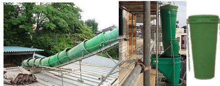
アタッチメントはお気軽にお問い合わせ下さい

【車輪付BOXパレット 1000kg】 長650mm×幅930mm×高770mm