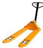
バリエーションはお気軽にお問い合わせ下さい