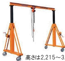
高さは2,215~3,125mm伸縮式です