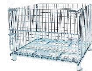
バリエーションはお気軽にお問い合わせ下さい