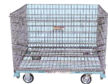
バリエーションはお気軽にお問い合わせ下さい

【車輪付BOXパレット 1000kg】 長650mm×幅930mm×高770mm