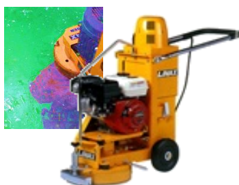
【エンジンライナックス】

【超高压洗浄機SER1450】 ガソリンエンジン搭載 157kg 超高压水圧で断熱フォームを 瞬間的に剥離します！