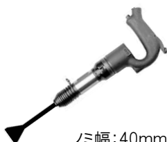
ノミ幅:40mm 丸シャンク

【F2フラックスチッパー】 空気量0.4m 3 /min 1.85kg 細部の剥ぎ取り等に絶大な 威力を発揮する専用品です。