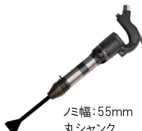
ノミ幅:55mm 丸シャンク

【エアベビーチッパー】 空気量0.35m 3 /min 2.45kg 軽量なので高いところも楽々。 平ノミは機種専用品です。