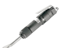
ノミ幅: 25mm 60mm

【F2フラックスチッパー】 空気量0.4m 3 /min 1.85kg 細部の剥ぎ取り等に絶大な 威力を発揮する専用品です。